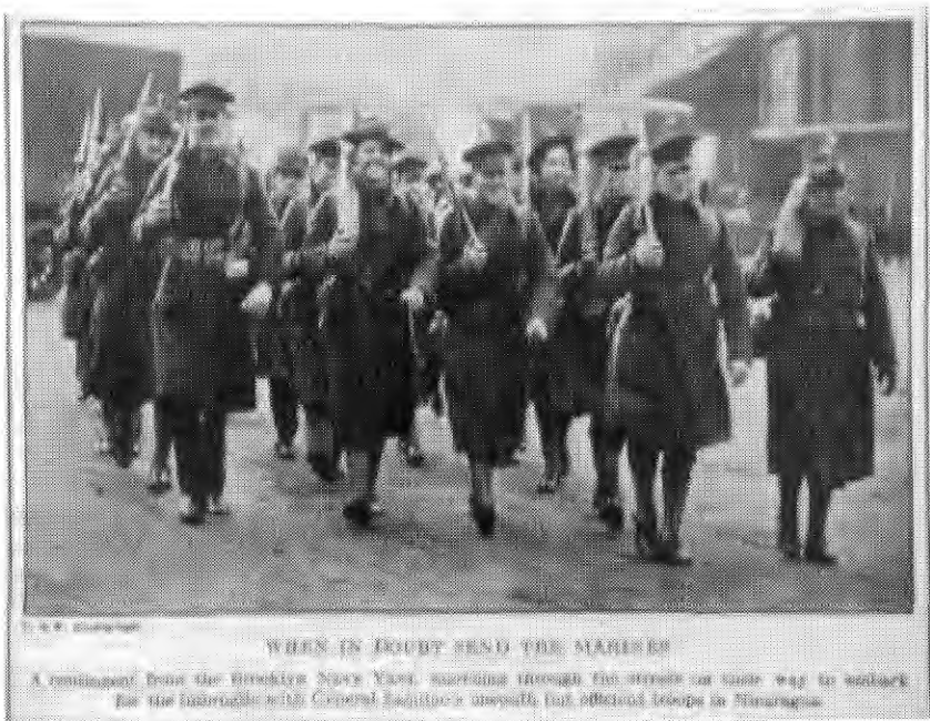
Marinos de Brooklyn rumbo a Nicaragua The Literary Digest , 4 febrero 1928, p.44